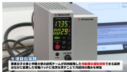
生理痛を再現する電流の装置

※ニュースリリースに記載している情報は、発表日時点のものです。現時点では、発表日時点での情報と異なる場合がありますので、あらかじめご了承くださいとともに、ご注意をお願いいたします。