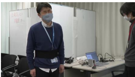
男性社員が生理痛疑似体験をする様子

「SHINING 活動」で行った社内アンケートでは、生理休暇の取得者は7%にとどまり、83%の女性社員が生理休暇を取得しづらいと回答。そこで生理休暇を取得しやすい職場環境づくりに向けた施策案を策定し、その一環として男性社員の生理への理解を深めてもらうため、NTT フィールドテクノのマネジメント層の男性社員を対象に、生理痛を疑似体験できる装置を使った生理体験を2023年3月に実施しました。