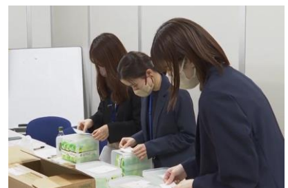
生理用品設置の様子